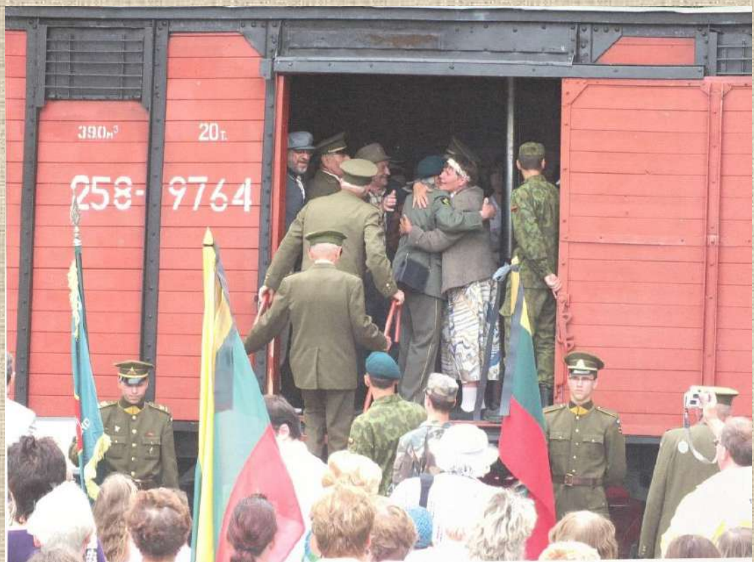
Radviliškyje surengta tremties įvykių rekonstrukcija. 2013 m. birželio 14 d.