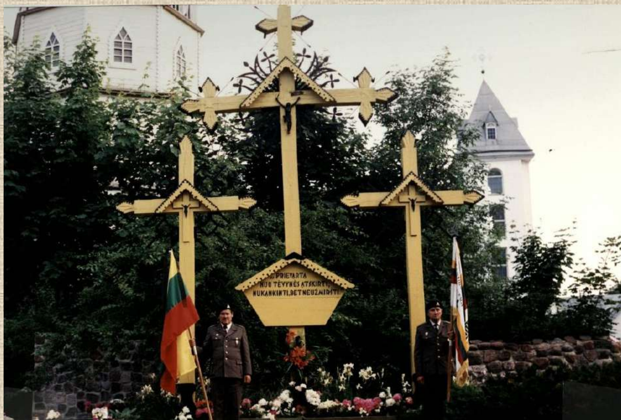
Gedulo ir vilties dienos paminėjimas. 1999 m. birželio 14 d.