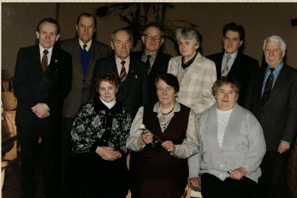
LPKTS Radviliškio skyriaus Tarybos nariai. 1998 m. vasario 21 d.