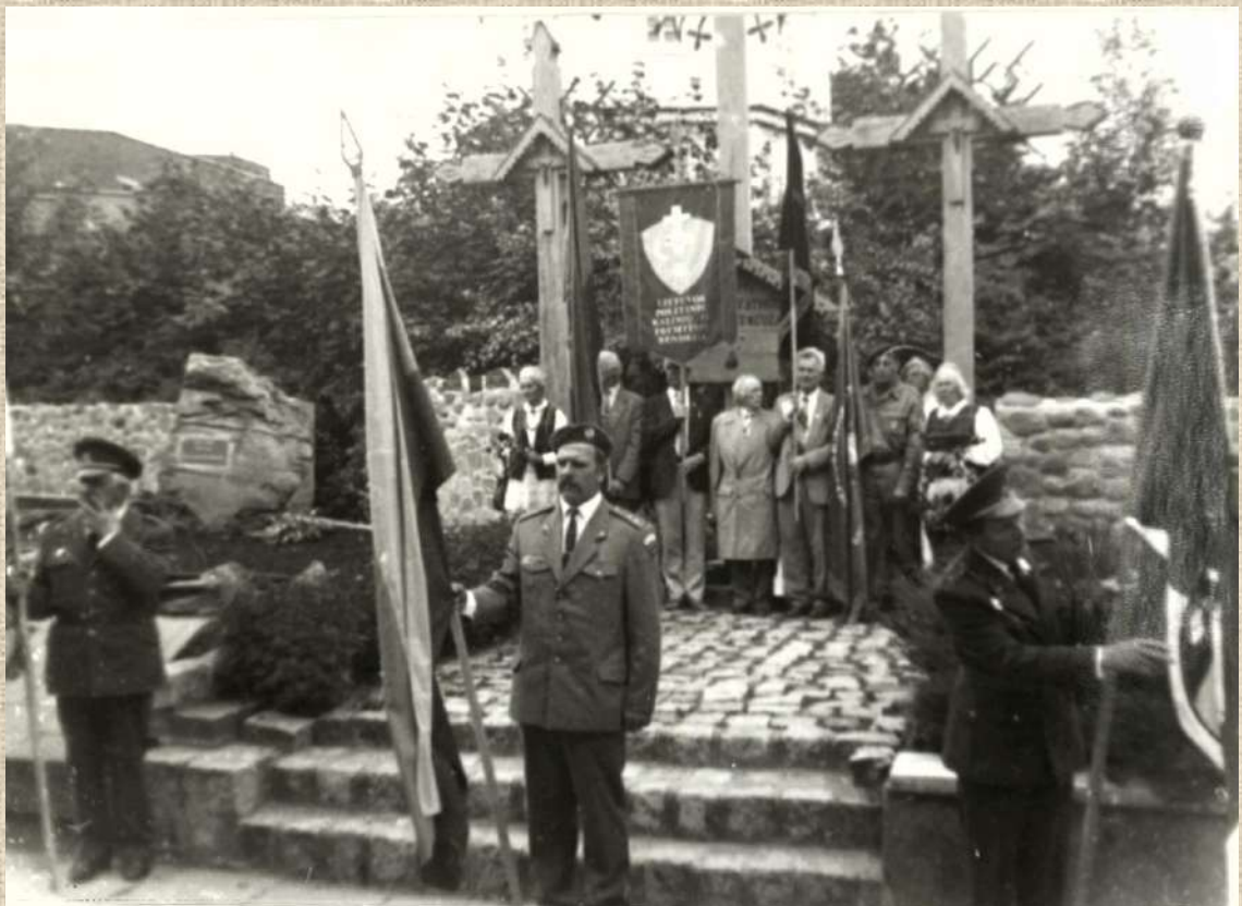
Minėjimas, skirtas Gedulo ir vilties dienai. 1997 m. birželio 14 d.