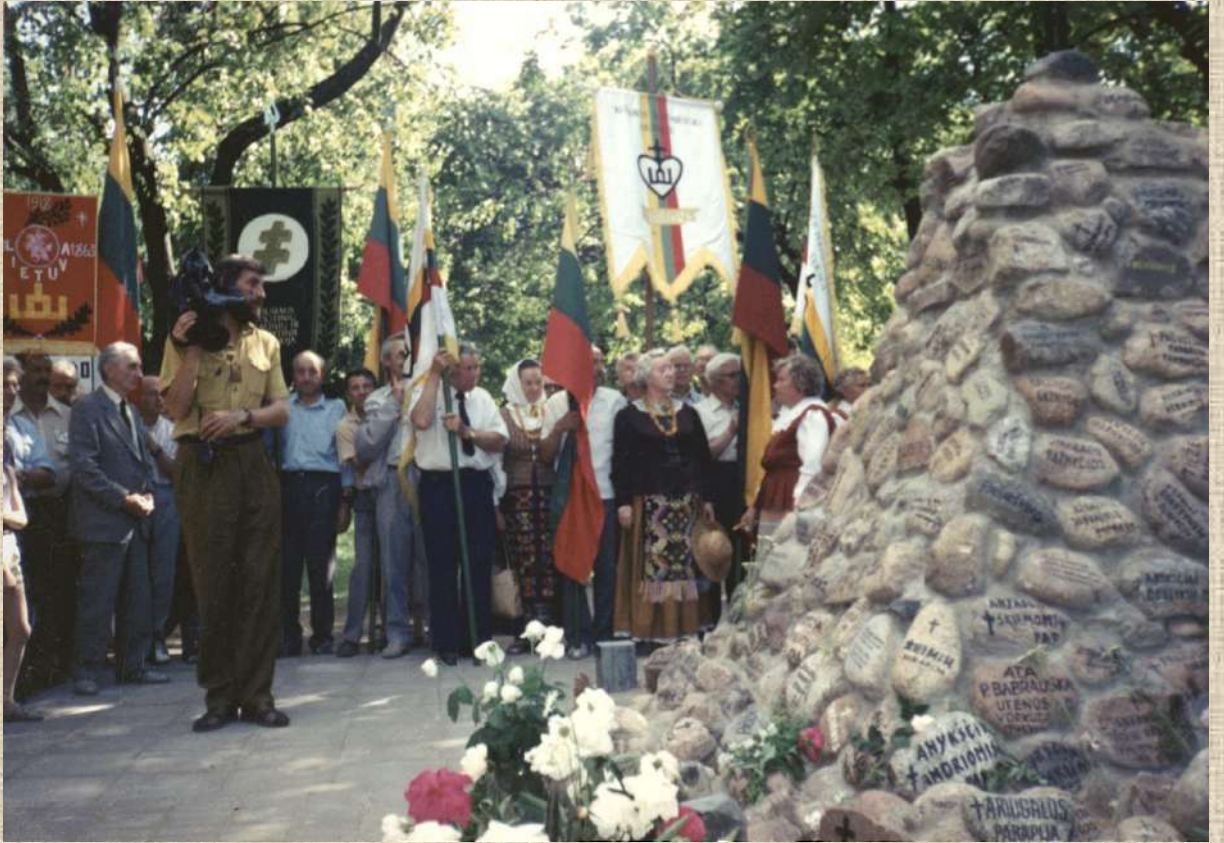
Tremtinių ir politinių kalinių susitikimas su užsienio lietuviais prie Skaismo piramidės Vilniuje. 1994 m. liepos 9 d.