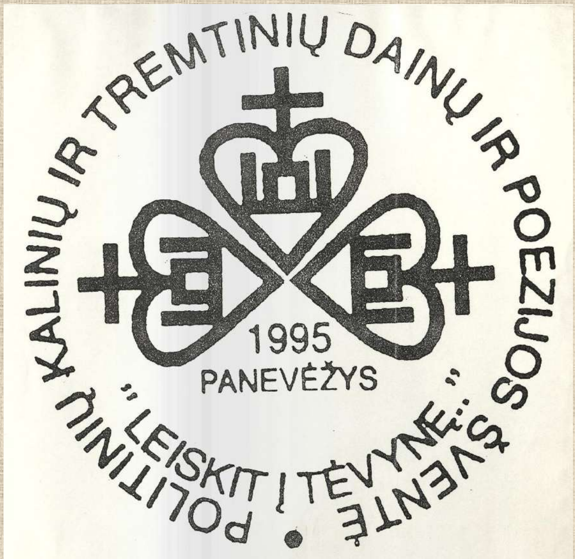
Politinių kalinių ir tremtinių Dainų ir poezijos šventės „Leiskit į Tėvynę“ emblema. 1995 m.