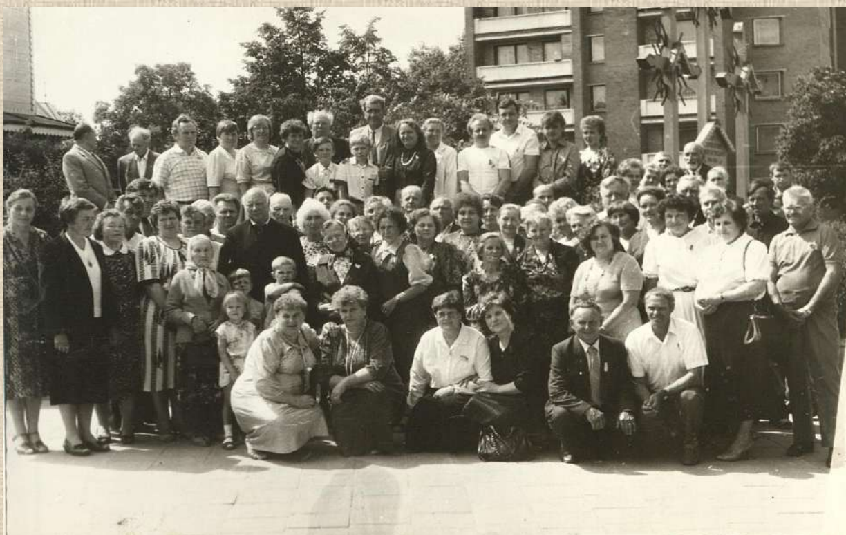
Lietuvių tremtinių, kalėjusių Irkutsko srityje, susitikimas Radviliškyje. 1991 m. liepos 27 d.