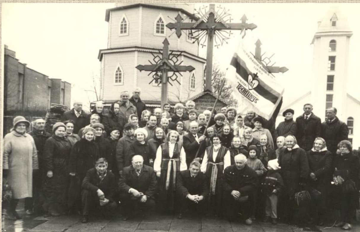
Politinių kalinių ir tremtinių sąjungos vėliavos šventinimo ceremonija prie kompozicijos „Skausmo ir kančios kelias“. 1992 m.