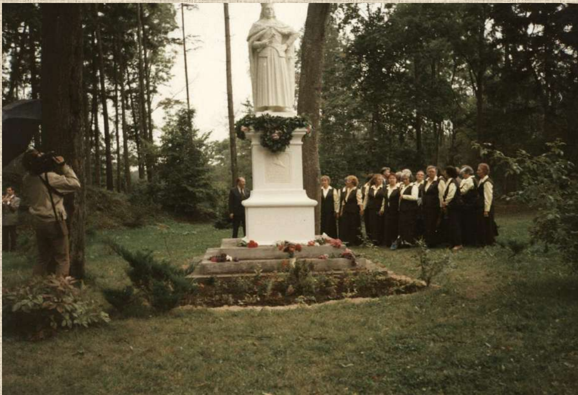
Radviliškio PKTS choro dainininkai prie Kunigaikščio Vytauto Didžiojo paminklo Burbiškio parke. 1995 m. rugsėjo 9 d.