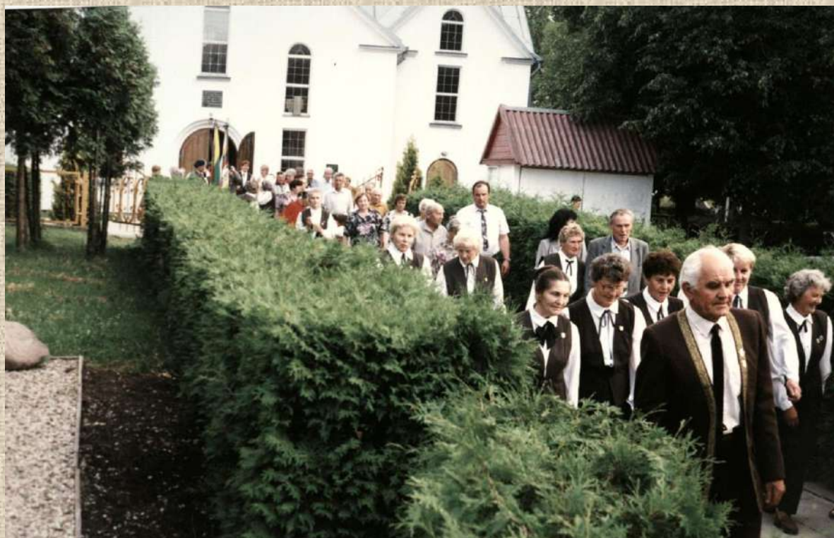
Choro „Versmė“ dalyviai po koncerto bažnyčioje išeina prie kompozicijos „Skausmo ir vilties kelias“. 1999 m. birželio 14 d.