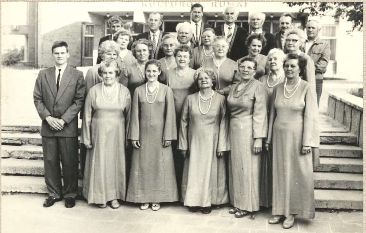
Politinių kalinių ir tremtinių choras „Versmė“ repetacijos metu prieš chorų šventę, kuri vyko Vilniuje, Kalnų parke. 1993 m. birželio 11 d.