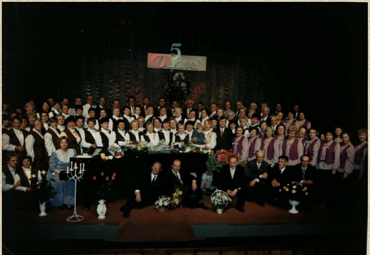
Choro „Versmė“ 5-erių metų jubiliejus. Scenoje – miesto choras, choras „Versmė“ ir tremtinių choras iš Jonavos. 1998 m. gegužės 16 d.