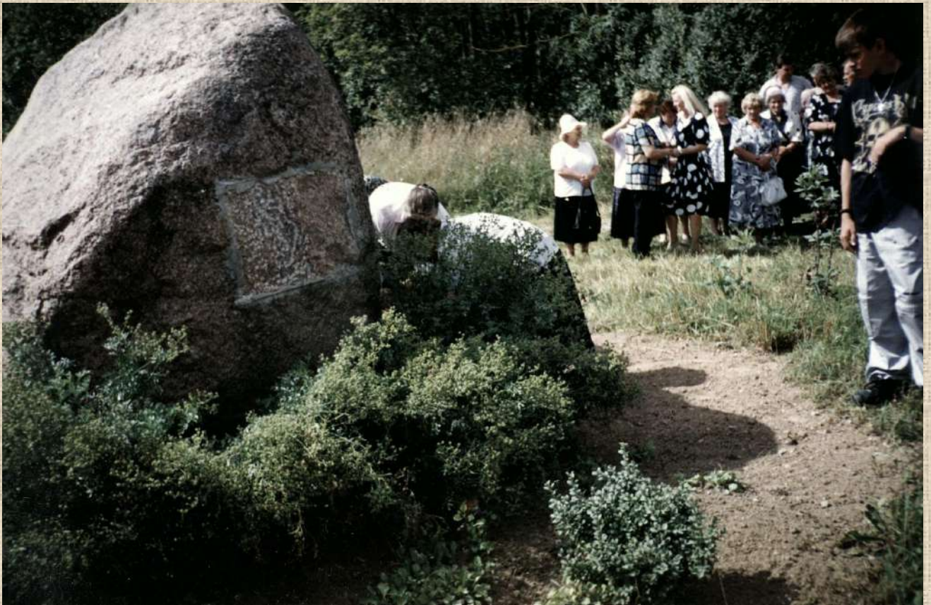
Juodojo kaspino dieną tremtiniai aplankė partizanų žuvimo vietas. 2002 m. rugpjūčio 23 d.