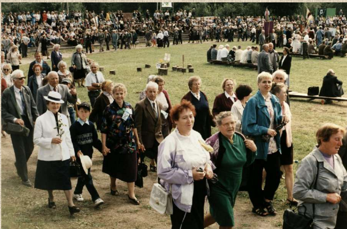
Radviliškėčiai tremtiniai – Tremtinių ir pasipriešinimo dalyvių šventėje Ariogaloje. 1998 m. rugpjūčio 8 d.