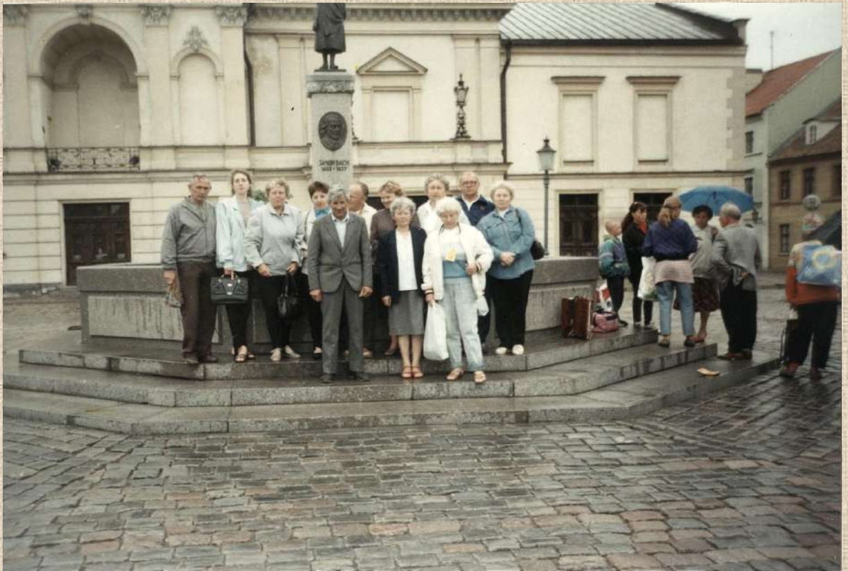
Radviliškėčių choristų viešnagė Klaipėdoje. 1997 m. liepos 21 d.