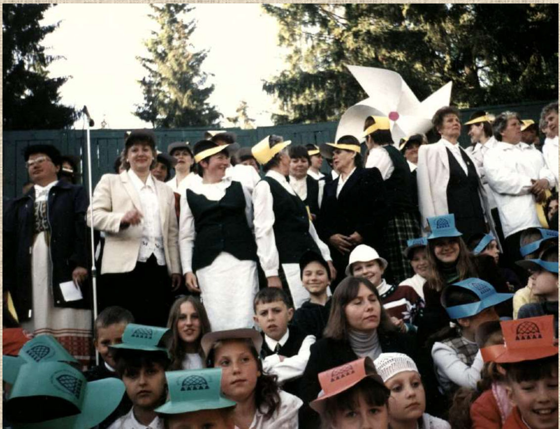
Choras „Vermė“ dalyvavo tradicinėje rajono meno šventėje Antaniškių parke. 2001 m. gegužės 26 d.