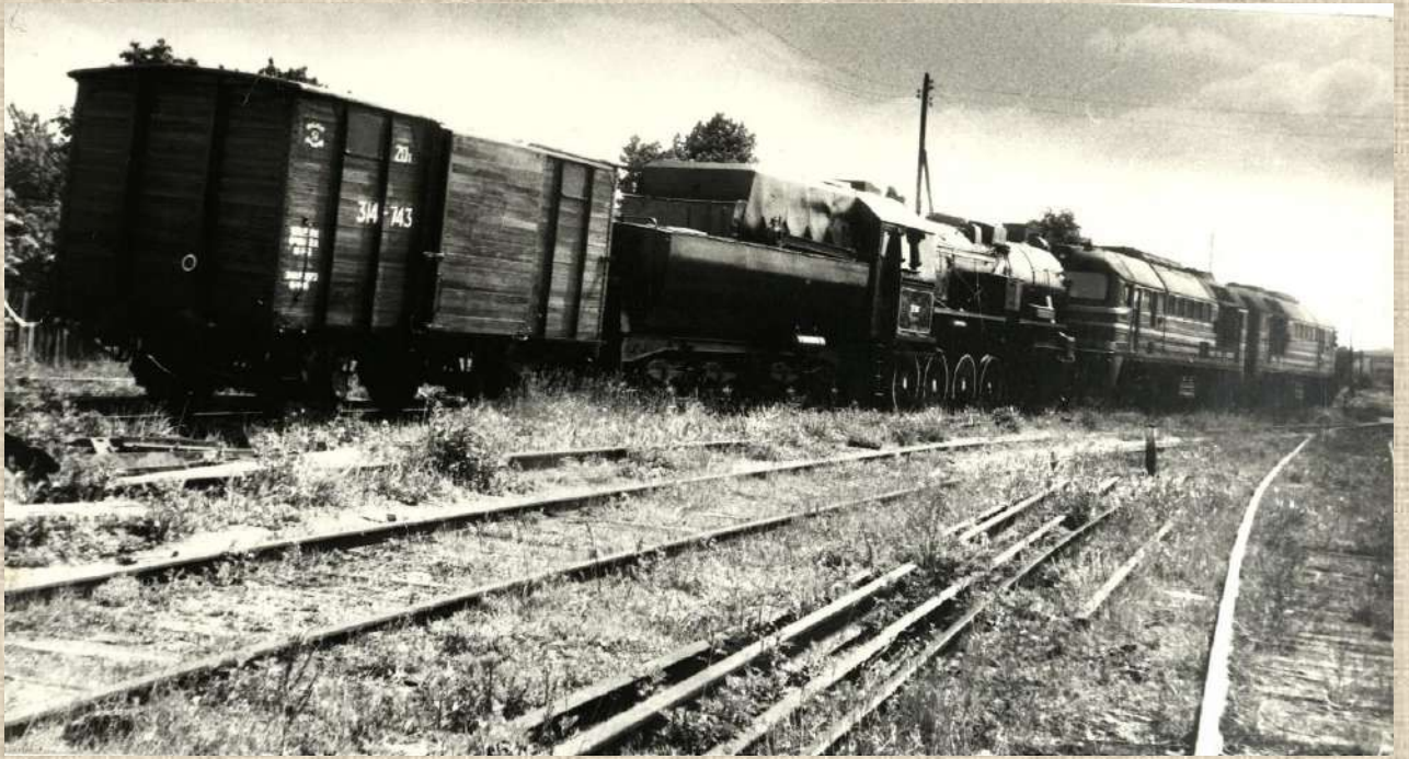
Tremtinis vežes vagonas buvo palydėtas į muziejų Vilniuje. 1994 m.