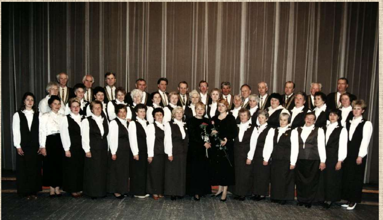
Politinių kalinių ir tremtinių choras „Versmė“. 1997 m. gegužės 22 d.