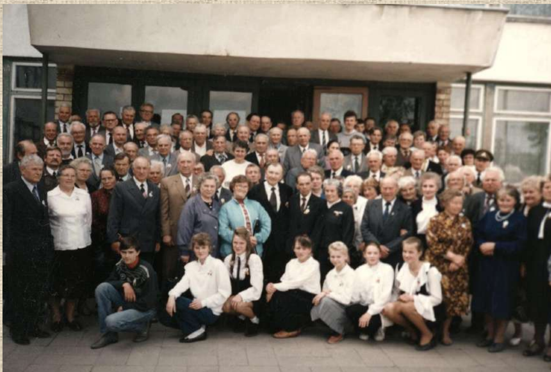
Respublikinis „Norilsko Vyčių“ suvažiavimas Radviliškyje, Gražinos vid. mokykloje (dabar Gražinos pagrindinė mokykla). 1995 m. gegužės 27 d.