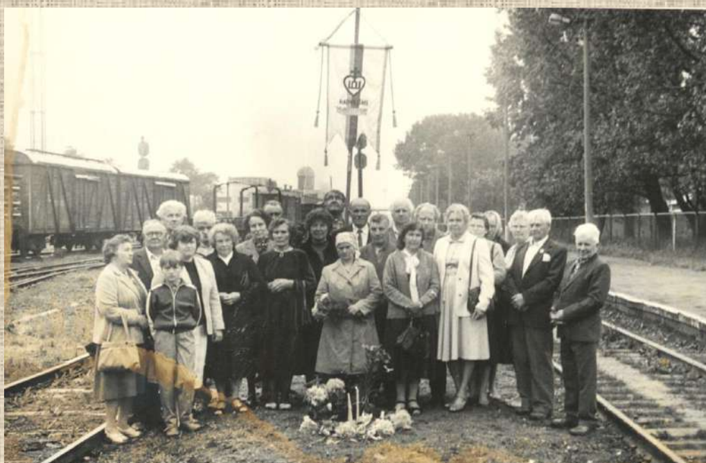
Žmonės pagerbia vietą, kur stovėjo trėmimų vagonai. 1994 m. birželio 14 d.