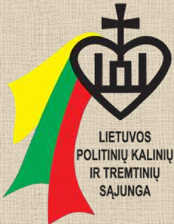
Lietuvos politinių kalinių ir tremtinių sąjungos ( LPKTS ) logotipas

Lietuvos politinių kalinių ir tremtinių sąjunga – asociacija, vienijanti buvusius tremtinius, politinius kalinius ir Laisvės kovų dalyvius, įkurta 1988 metais. Įsikūrusi Kaune, Laisvės al. 39.