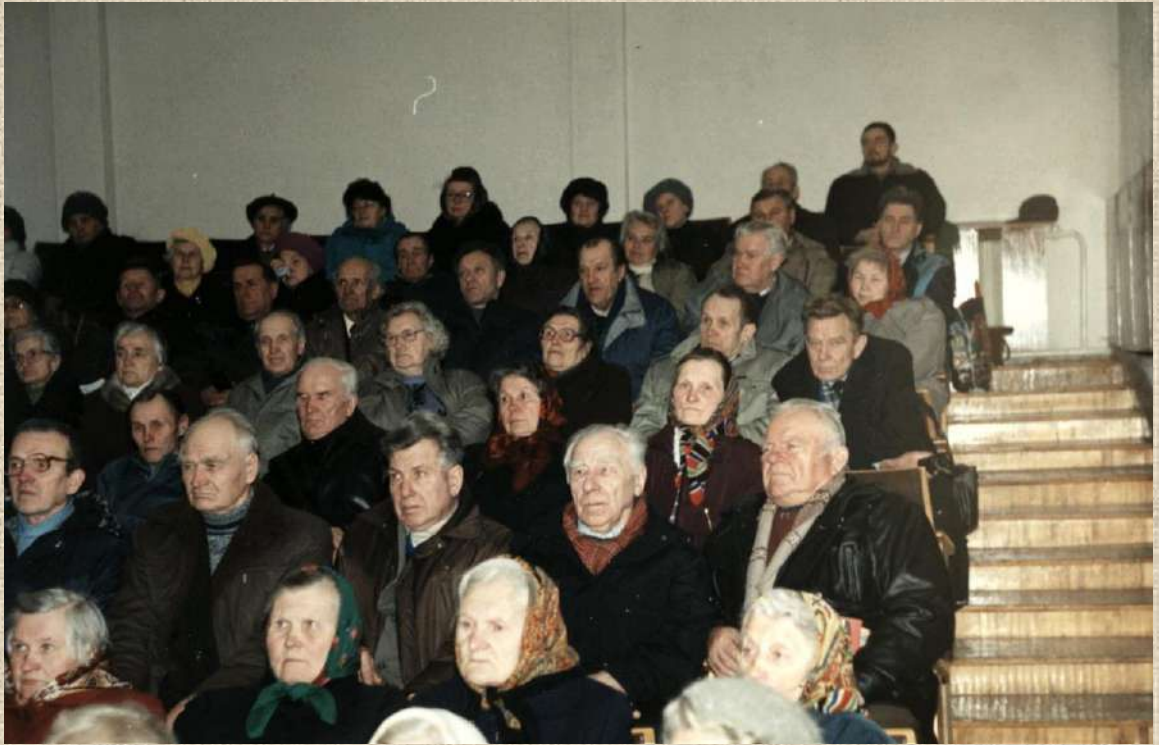
Radviliškio skyriaus politinių kalinių ir tremtinių ataskaitinis susirinkimas. 1997 m. kovo 15 d.