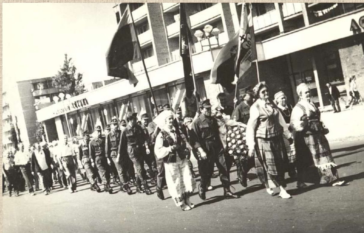
Tradicinis Karagandoje kalėjusių politinių kalinių ir tremtinių susitikimas ir eisena Radviliškio gatvėmis. 1992 m. rugpjūčio 1 d.